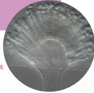
コウジカビ 顕微鏡拡大写真