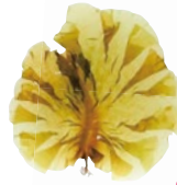
ヒロメ 標本 国立科学博物館