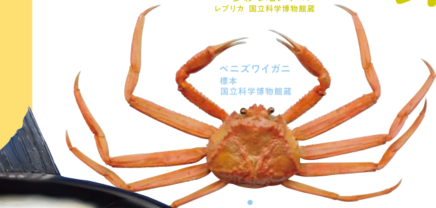
ベニズワイガニ 標本 国立科学博物館