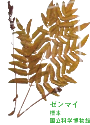
ゼンマイ 標本 国立科学博物館