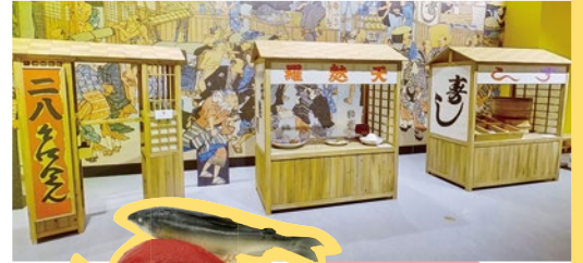
当時の大きさを再現した 握り寿司(模型)が屋台に!