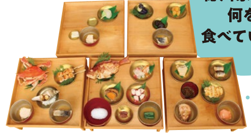
織田信長が徳川家康をもてなした本膳料理の再現模型 奥村彰生監修 御食国若狭おほま食文化館蔵