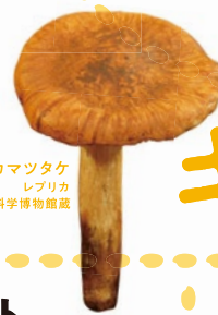
パカマツタケ レプリカ 国立科学博物館