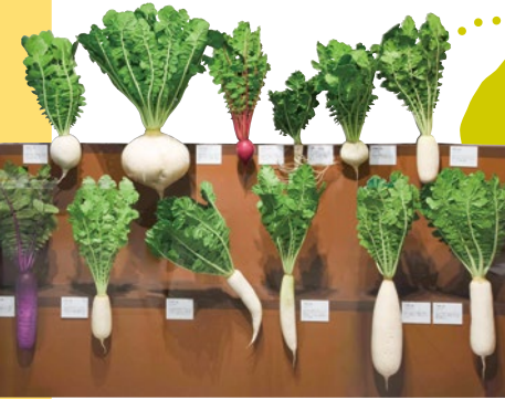
多彩な地ダイコン レプリカ 国立科学博物館