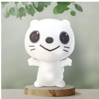
ぐりりぬいぐるみ